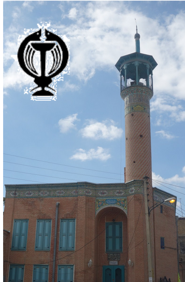
دفتر توسعه تحقیقات بالینی

در صورتی که بیمار شما کودک می باشد و دوست دارد از وسایل بازی خود همراه داشته باشد سعی نمائید از وسایل بازی بی خطر و قابل شستشو استفاده نمائید در غیر این صورت به منظور پیشگیری از انتقال عفونت های بیمارستانی از عودت آن به محل زندگی اجتناب نمائید . در صورتی که بیمار تمایل به خواندن کتاب و مجله دارد آن را برای بیمارتان فراهم نمائید .